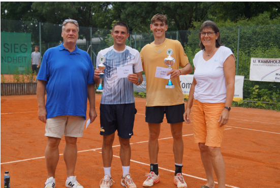
Foto der Siegerehrung 2025 - wir sind gespannt auf die Meldungen 2026!

Wir werden wie immer unser Bestes geben, um viele motivierte Tennisspielerinnen und Tennisspieler zu unseren Turnieren zu bringen – und freuen uns darauf, die Eichenau Open erstmals mit unserem neuen Clubhaus als Kulisse auszurichten.