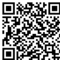
BTV Website TCE

Verfolgt unsere Mannschaften während der Saison immer auf der BTV-Website oder über die TCE-Community und die Gruppe "Ergebnismeldung"!